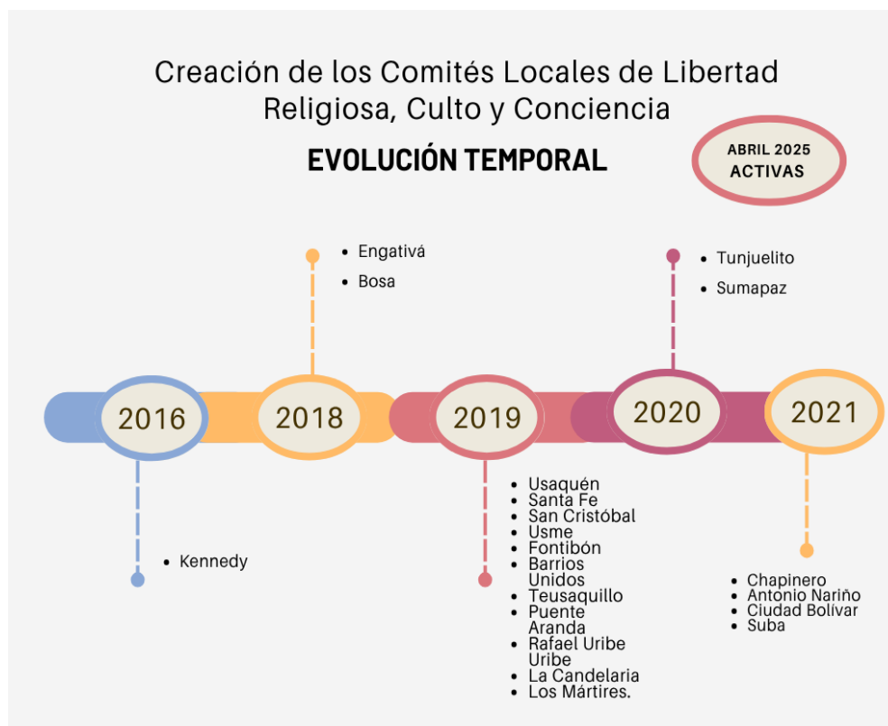
Gráfico N°1. Creación de los Comités Locales de Libertad Religiosa, Culto y Conciencia (2016-2021)

Fuente: Elaboración propia. IDPAC – Observatorio de la Participación. 2025.